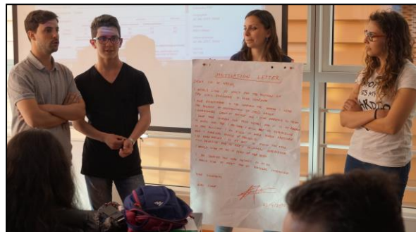
Slika 6 Radionica "Izrada i prezentacija životopisa"