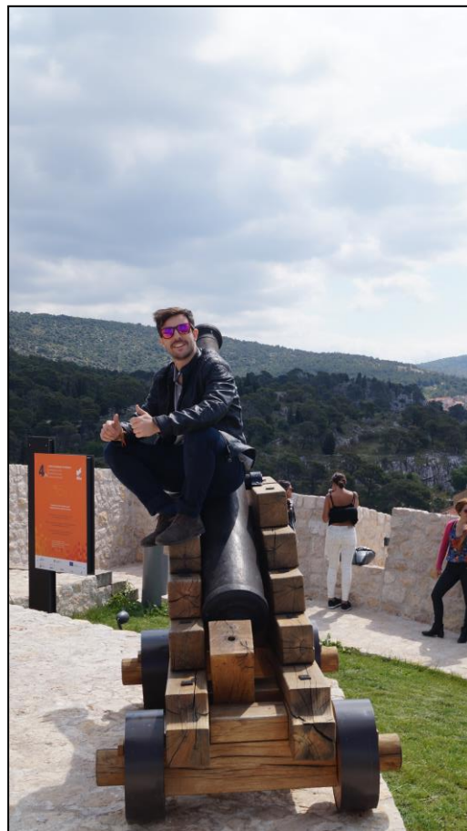
Slika 8 Razgledavanje tvrđave Barone

Osim na društvenim i web mrežama svi materijali dostupni su na uvid i prilikom upita u uredima udruge mladih "Mladi u Europskoj uniji". Također, radili smo na izradi dva Newslettera od kojih prvi je bio izrađen prije početka aktivnosti s detaljima o projektu, opisom smještaja i očekivanjima od projekta, dok drugi Newsletter koji je pripremljen za diseminaciju nakon završetka projektnih aktivnosti sadrži informacije od diseminaciji, provedenim aktivnostima i dostignutim ciljevima projekta (Newsletteri su napisani na hrvatskom i engleskom jeziku). Ti isti Newsletteri prosljeđeni su partnerima na projektu te su oni zaduženi za prosljeđivanje