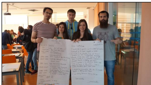
Slika 5 Radionica "Metode pisanja motivacijskih pisama"