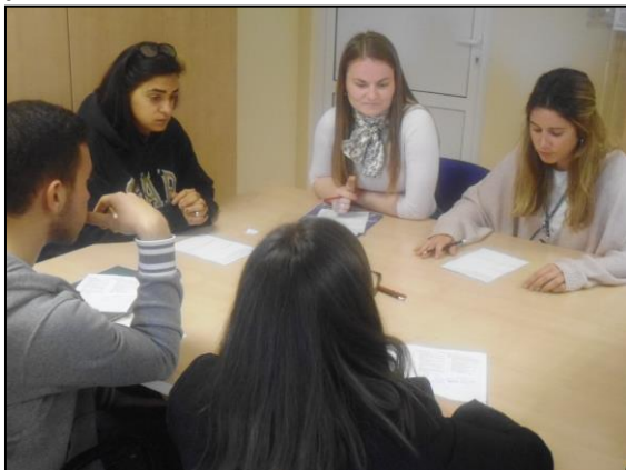
Slika 1 Kako se pripremiti za razgovor za posao

Tokom posljednje i treće faze biti će organizirana konferencija na kojoj će biti prezentirani rezultati koji su proizišli iz projekta, također kao oblik diseminacije i širenja dobre prakse koristiti će se i newsletter koji će biti dostupan na hrvatskom i engleskom jeziku.