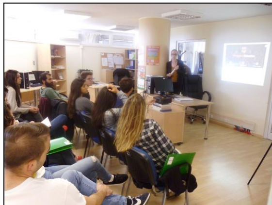
Slika 3 Radionica "Kako predstaviti volonterska iskustva na prijavi za posao"

Glavni cilj ovog projekta je dati uvid mladim i nezaposlenim osobama u postupak traženja posla i naučit će kako izraditi kvalitetan životopis, kako se pravilno postaviti i ostaviti što bolji dojam na razgovoru za posao, potaknuti će ih se na samozapošljavanje kroz društveno/zeleno poduzetništvo te će naučiti kako izraditi plan traženja zaposlenja koji će moći po povratku u svoje zemlje praktično primjenjivati.