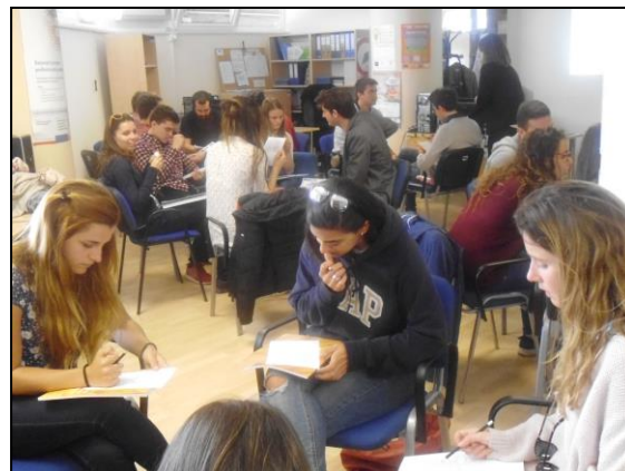
Slika 2 Simulacija razgovora za posao u CISOK centru prezentaciju i izlaganje pred grupom, unaprijedili su svoje samopouzdanje te stekli naviku interaktivnog sudjelovanja u zajedničkim zadacima.

Višestruke su koristi predloženog projekta za dionike koji će njime biti obuhvaćeni. Sudionici su trebali koristiti komunikaciju na engleskom jeziku tijekom cijelog projekta (u pripremnoj fazi prilikom sudjelovanja u izradi materijala za glavne aktivnosti, aktivno sudjelovanje na glavnim aktivnostima te prilikom komunikacije s ostalim partnerima i sudionicima za provođenje aktivnosti širenja projektnih rezultata), te su samim tim unaprijediti svoja znanja i vještine korištenja istoga. Kroz komunikaciju sa ostalim sudionicima te