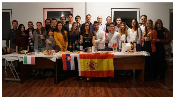
Slika 7 Međunarodna večera

Nakon radionica, okruglih stolova i predavanja ostaje sasvim dovoljno vremena i za kulturne i zabavne sadržaje gdje se sudionici mogu opustiti i dodatno upoznati. Tako su prvog dana aktivnosti sudionici imali priliku razgledati Šibenik i njegove znamenitosti kao što je katedrala Sv. Jakova, prošetati se starom Kalelargom i razgledati panoramu s tvrđava Sv. Mihovil i Barone. Kao i tokom svake razmjene mladih i tokom ove smo organizirali međunarodnu večer, večer tokom koje se predstavlja Europa onakva kakva i jest kada se za stolovima različitih zemalja članica mogu vidjeti identična a ponekad i ista tipična jela ali istovremeno svako sa svojom pričom i tradicijom.