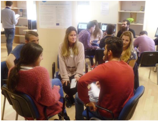
Simulacija razgovora za posao